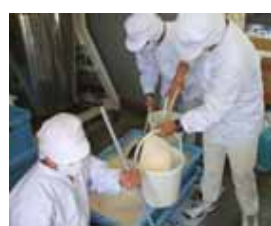
せっけんの製造をしています。