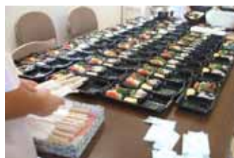
おりいぶ 1 号館では手作りのお弁当を販売しています。

工房阿列布やおりいぶファクトリーでは、オリジナルのせっけんやパンなどを製造・販売しております。手作りのお弁当も承っております。