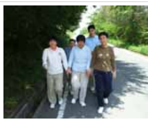
晴れた日は、近くを散策します。

身の自立や普段の生活の中で作業重視ではなく、自立のための訓練が必要な人へのサービスです。