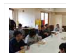
さくら会総会 事業計画などを真剣に決めています。

レスパイト事業(時間延長、宿泊) 体験活動(旅行、ドライブ、温泉、外食など) 預貯金支援 利用者の自治会『さくら会』支援