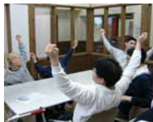
楽しく体を動かしてストレッチ運動をします。