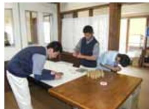
みんなで協力して、下請け作業に取り組んでいます。